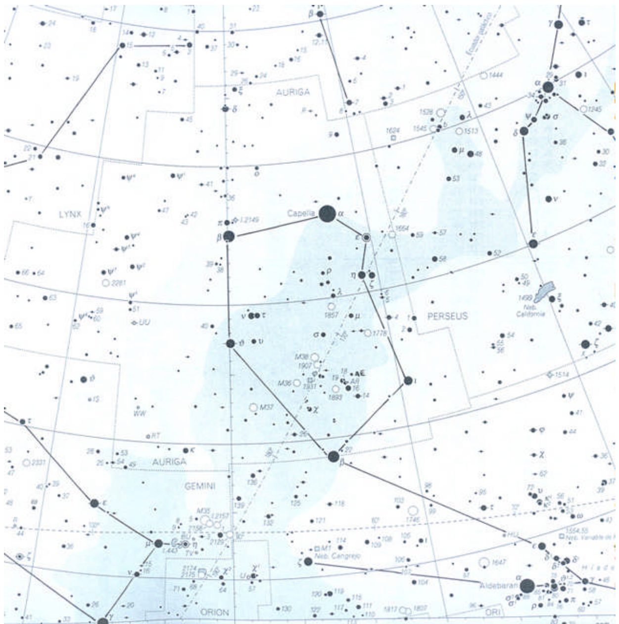
MAPA CELESTE (PARCIAL) CON LA LOCALIZACIÓN DE CAPELA, ESTRELLA (DE MAYOR BRILLO) DE LA CONSTELACIÓN DEL COCHERO