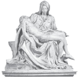
Pietà, celebre escultura de Miguel Ángel

En la noche del primero de diciembre de 1984, el espíritu Emmanuel dictó por intermedio