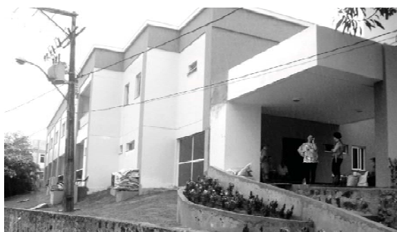
Centro de Parto Natural, en la Mansión del Camino, en Salvador, Bahía, Brasil.

atención se amplió, abarcando a más niños y jóvenes necesitados, a través de escuelas y talleres de formación profesional, y por eso se puede decir que ya fueron atendidos por la